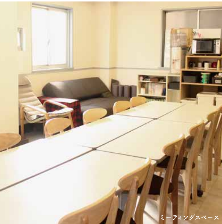
ミーティングスペース